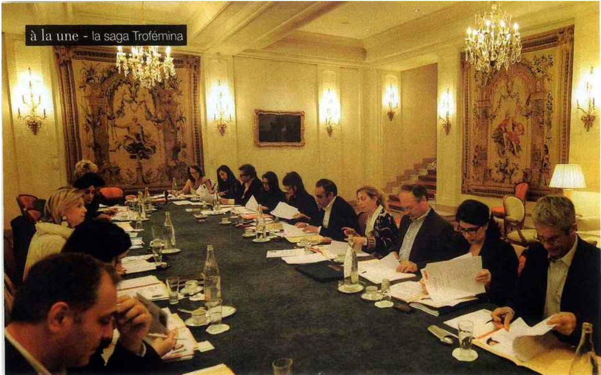
Le jury très concentré pour retenir les 20 nommées du prix 2011.